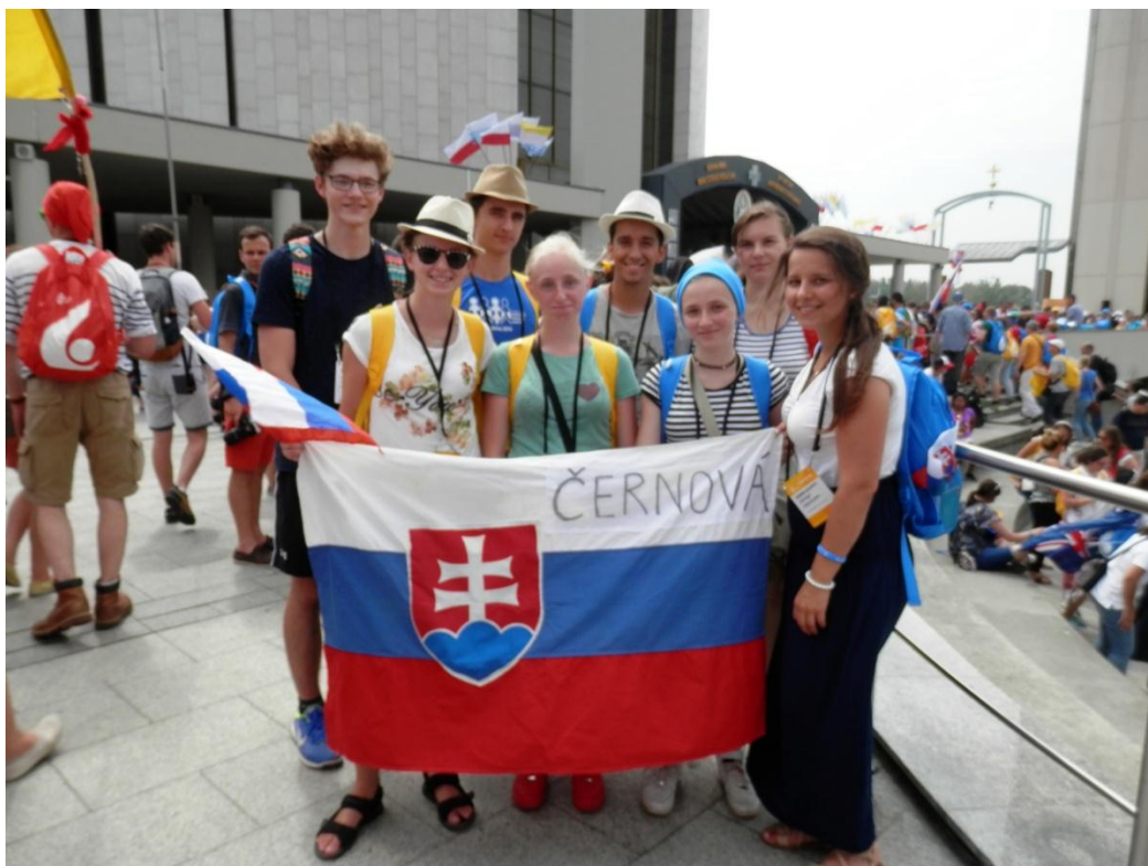
púť do Sanktuária Božieho Milosrdenstva v Krakov-Lagievniky