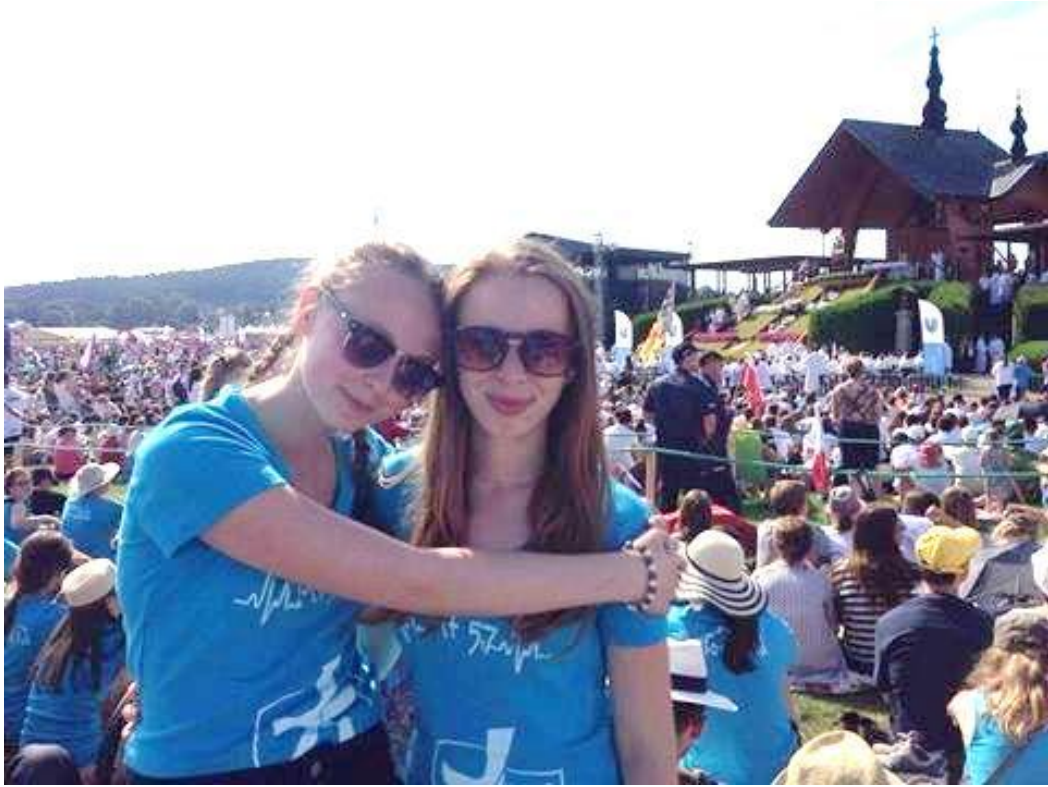
zážitky z Dní v diecéze