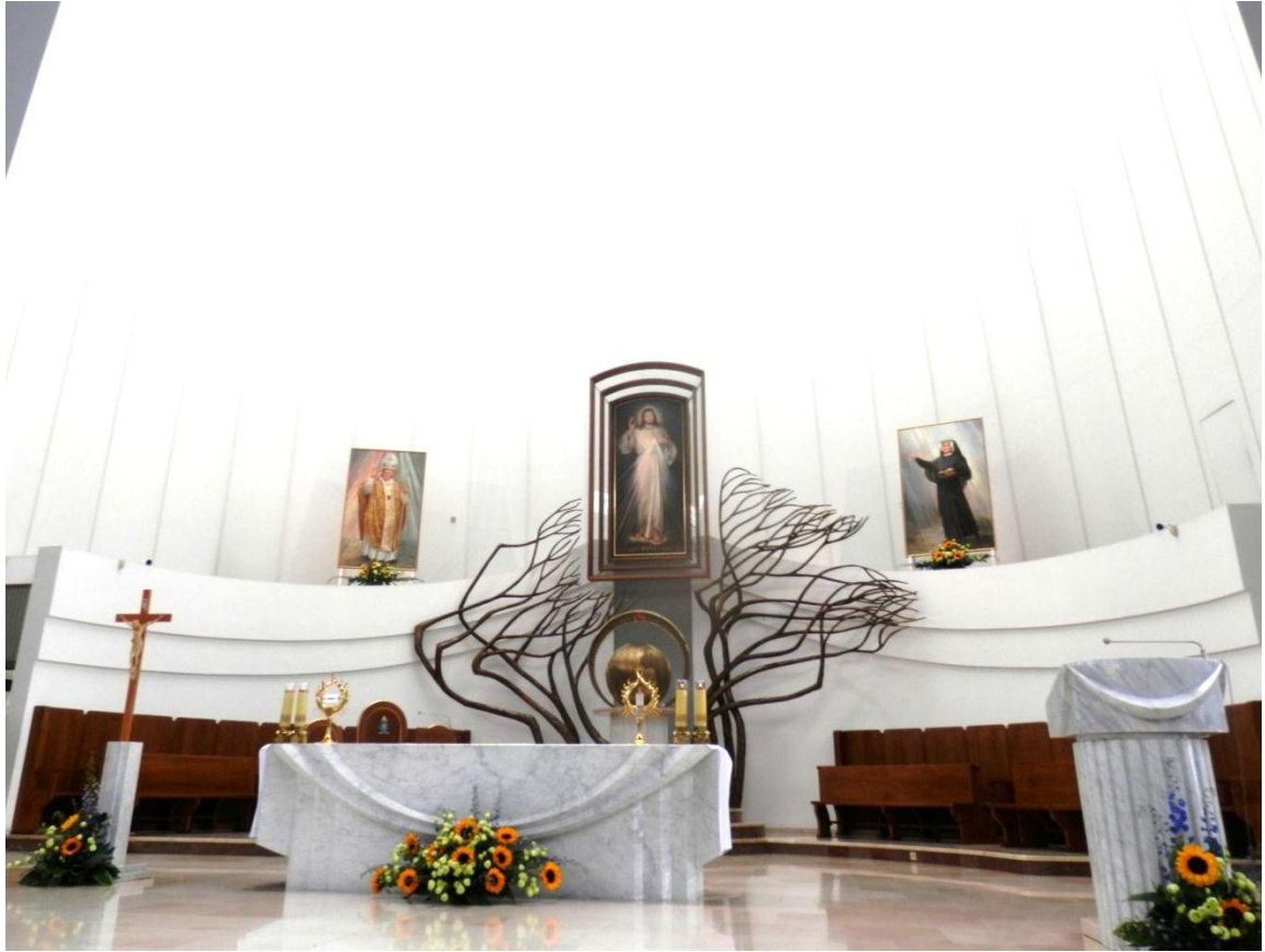
púť do Sanktuária Božieho Milosrdenstva v Krakov-Lagievniky