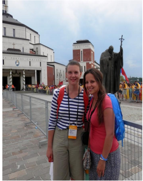
Svätýňa svätého Jána Pavla II. v Krakove