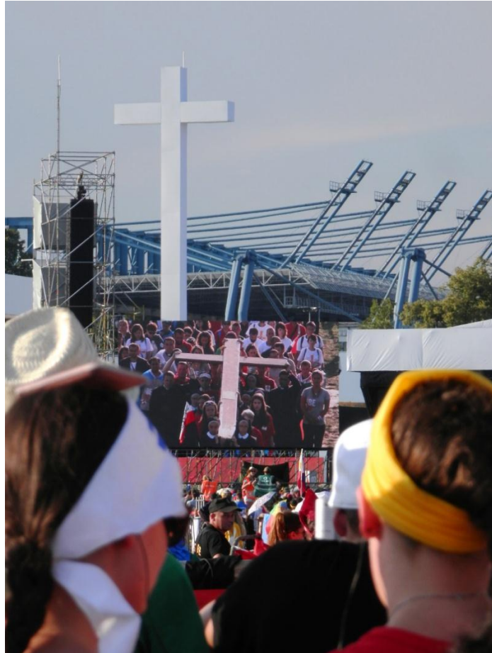
Křížová cesta so Svätým otcom na Błonie, Krakov