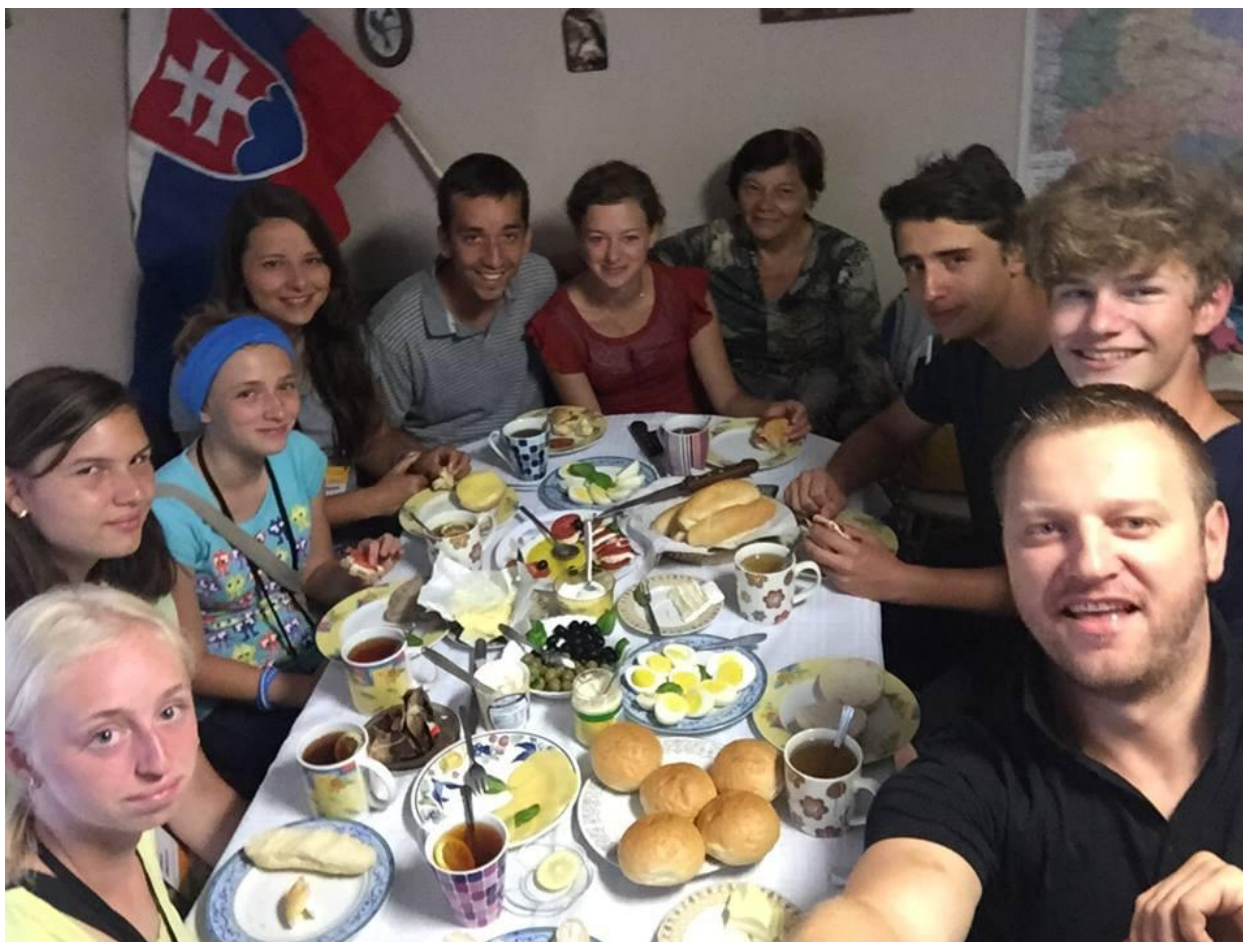
naše hosťujúca rodina, ktoré nás prijali a ubytovali