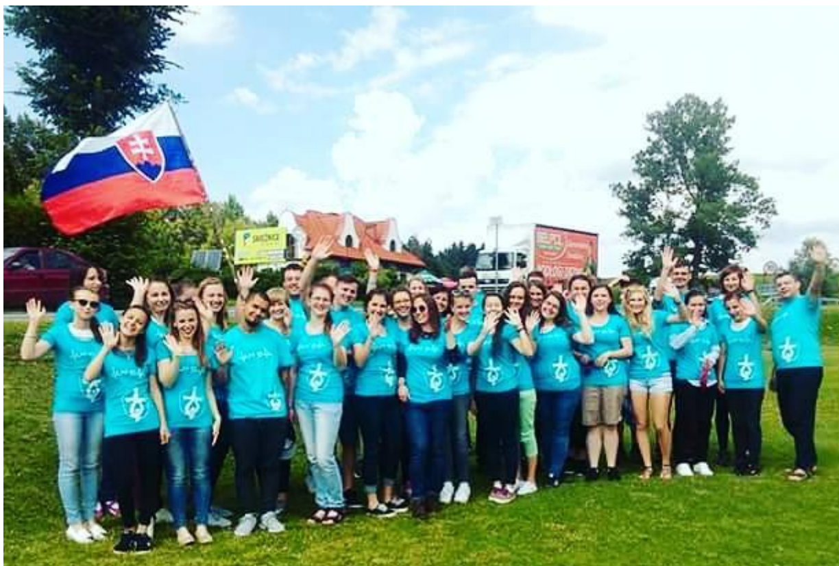
okamihy z Dní v diecéze